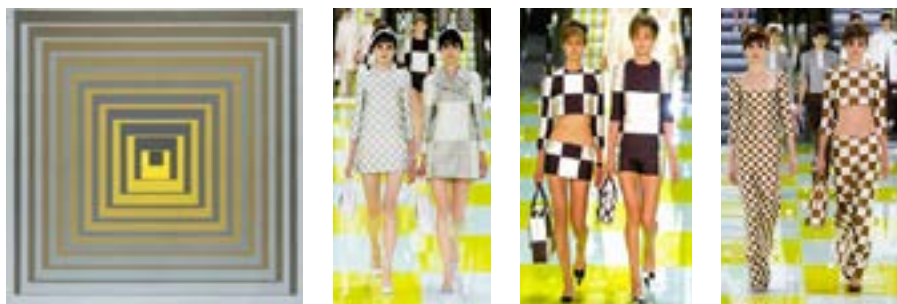
Рисунок 2. Виктор Вазарели. Vonal — Ksz 1968 Louis Vuitton. Весна-лето 2013

В коллекции Louis Vuitton весна-лето 2013 тема «фон-фигура» представлена очень детально. Используя приемы Вазарели, Марк Джейкобс (Marc Jacobs) вписал свое имя в кинетическое искусство оп-арта, представив коллекцию, состоящую из геометрических квадратов разной величины.