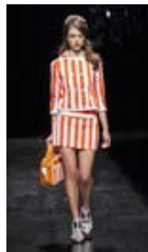
Рисунок 4. Mary Quant. 1960-е Moschino. Весна-лето 2013