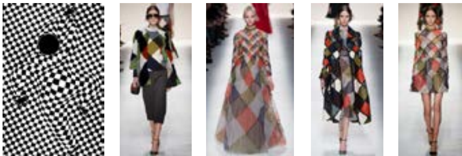
Рисунок 1. Виктор Вазарели. Арлекин. 1935 Valentino. Fw 2014/15

Тема итальянской комедии дель-арте является отправной точкой для коллекции Valentino осень-зима 2014/15 . Исследование оптических иллюзий цвета и его влияние на фактуру и силуэт происходит через технику пэчворка. Динамические структуры ромбов а-ля Арлекино представлены в разных фактурах — в коже, в мехе, в твиде, в шифоне, с совершенно разными способами обработки краев. Показ коллекции происходит на фоне абсолютно белых декораций, олицетворяющих белоснежность чистого холста, на которой проецируется изображение.