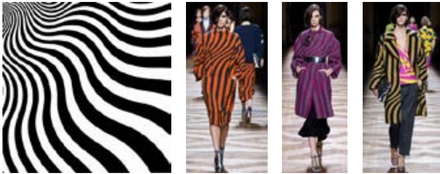
Рисунок 5. Bridget Riley. Intake 1964 Dries van Noten. Fw 2014/15

В этом же сезоне весна-лето 2013 художник Марк Джейкобс (Marc Jacobs) уже для собственного бренда показывает коллекцию, вдохновленную полотнами Бриджит Райли. Как видим, художник окунулся в атмосферу оп-арта достаточно глубоко. Он использует динамичные принты оп-арта, основанные на тонком дисциплинарном расчете, апеллирующем к реакции человеческой психики на яркость и контрастность. Абстракции оп-арта формируют образ человека, отвлекая полное внимание от изначальной внешности персоналии. В одежде с оп-арт принтом человек выглядит, как первобытный предупреждающий сигнал — яркий и опасный одновременно, от которого невозможно оторвать замороженный и счастливый взгляд. Это очень похоже на игру с детским калейдоскопом.