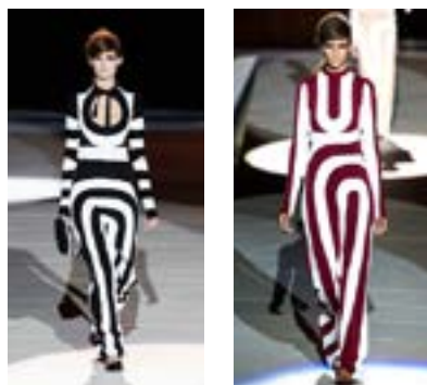
Рисунок 6. Marc Jacobs. Весна-лето 2013

жественных манифестах, формулировали выводы и демонстрировали формулы в собственных произведениях. Также художники оп-арта, работающие в новых экономических условиях, коснулись темы влияния количественного тиража произведений искусства на ценность самих произведений. Все эти темы не утратили собственной актуальности, и новый виток развития научной деятельности спровоцировал интерес к ранее сформулированной эстетике оп-арта с нового ракурса развития современного искусства, а именно — искусства создания одежды. Современный человек уже не воспринимает себя, как раньше, в трехмерном пространстве.